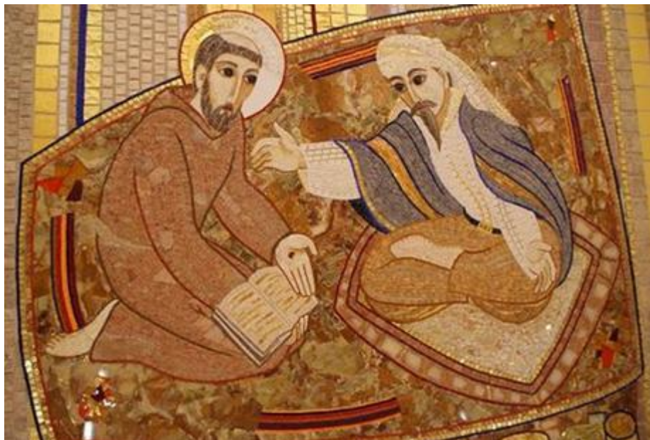
Francesco d'Assisi e il Sultano