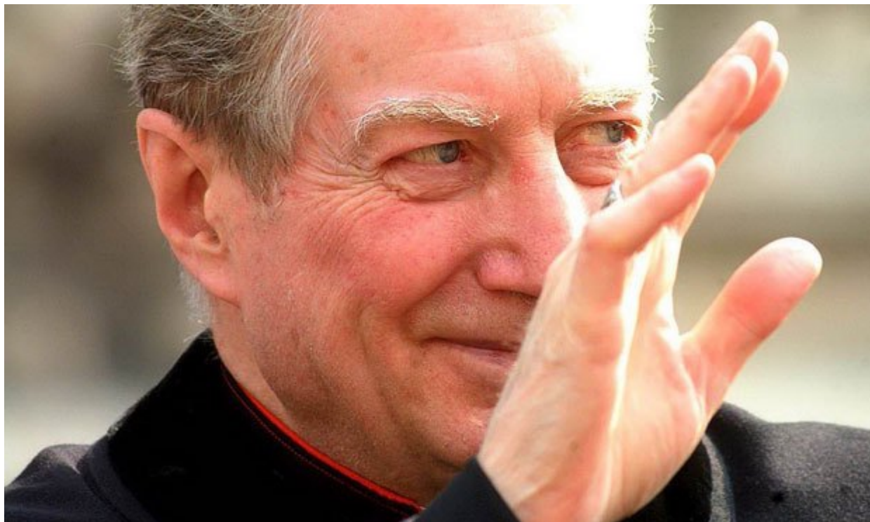
Card. Carlo Maria Martini, (Torino, 15 febbraio 1927 - Gallarate, 31 agosto 2012)

Noi e l'Islam. Un testo, prima ancora una riflessione, che il Cardinal Martini poneva all'attenzione della comunità cristiana e civile di Milano nel 1990. Visto quanto scrive e il modo in cui lo propone direi profetico. Un uomo e un pastore capace di farsi interrogare e interpellare da quanto sta accadendo nella società con grande lucidità e con grande coraggio, non eludendo le domande più difficili e spinose, e leggerlo alla luce della Parola. Profetico e dunque attuale perchè pone interrogativi e linee di riflessione su aspetti fondamentali che molto dicono anche a noi oggi.