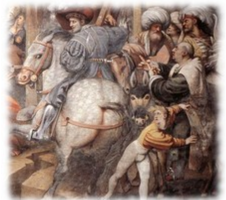
Il Pordenone, Crocifissione (particolare), duomo di Cremona, 1521