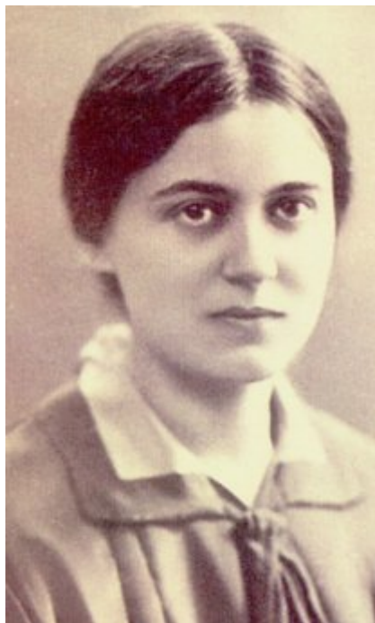
Edith Stein 1926

“Unsere Menschenliebe ist das Maß unserer Gottesliebe” (“Il nostro amore per l’uomo è la misura del nostro amore per Dio”)